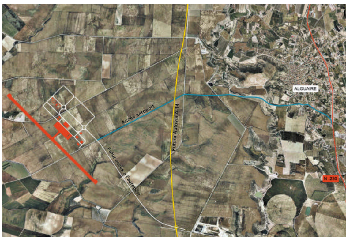
Ortofotomapa de situació de l'aeroport i els accessos

Així doncs, el pla director també pren en consideració altres infraestructures que existeixen a l'entorn de l'aeroport o es preveuen construir en el futur. D'aquesta manera, el pla incorpora la integració de l'aeroport amb la xarxa viària mitjançant la seva connexió tant amb l'actual carretera N-230 com amb la traça de la futura autovia A-14, que ha de substituir-la funcionalment com a via ràpida de gran capacitat entre Lleida i l'Alt Pirineu i Aran.